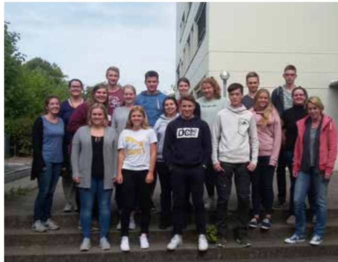
Gruppenfoto der Teilnehmer des Lehrgangs Ausbildungsassistent Schwimmen.