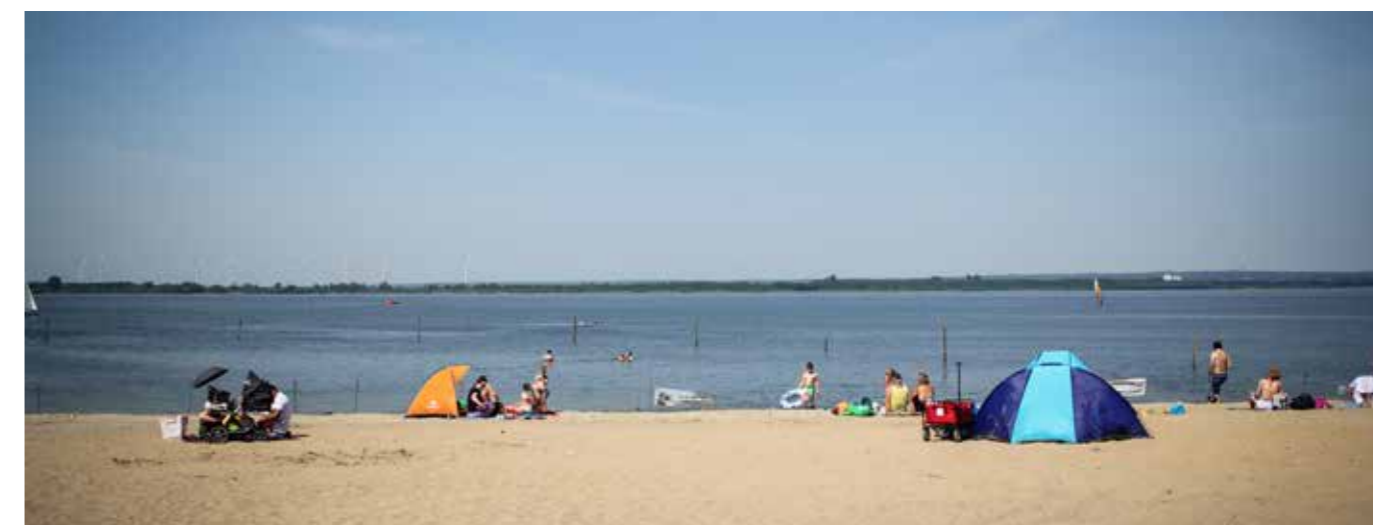
Das gute Wetter lud zu einer Abkühlung im Wasser ein.