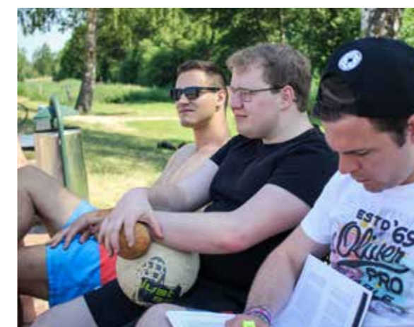
Ballspiele oder einfach nur die Sonne genießen: Beim Programm war für jeden etwas dabei. .