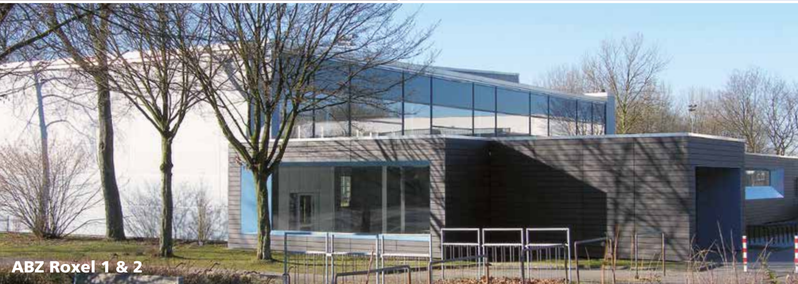
ABZ Roxel 1 & 2