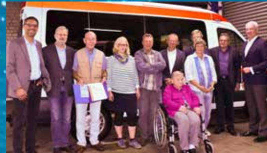
Mitgliedschaft-Ehrungen: Seite 09.