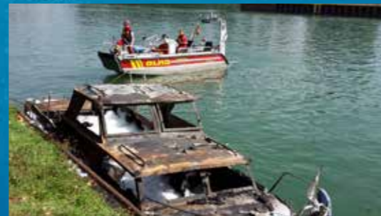
Schiffsbrand auf dem Kanal: Seite 27.