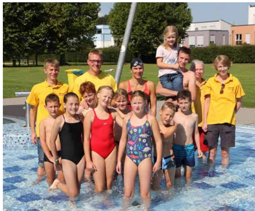
Gut gelaunt und voller sportlichem Kampfegeist: Die Schwimmerinnen & Schwimmer sowie das Betreuer team.