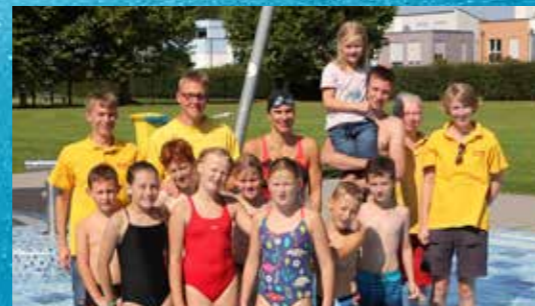
Stadtmeisterschaft Schwimmen: Seite 16.