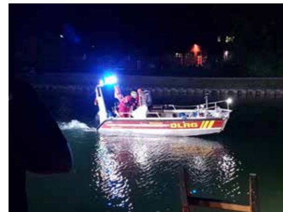
Mit dem Echolot (oben) wird der Grund des Gewässers untersucht. Gerade bei schlechten Witterungen und Dunkelheit eine große Hilfe für die Kameraden im Einsatz.

In diesem Sommer kam es gleich zweimal zu Einsätzen mit Brückenspringern, bei