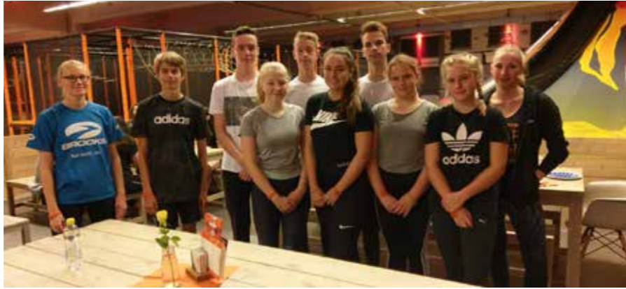
Anstrengend, aber super spaßig war das Hüpfen, Klettern und Hangeln in der Trampolinhalle Ninfly.

Besonders beliebt war der „Free Jump“. Gehüpft wie gesprungen – hier konnten wir nach Lust und Laune springen! Die Schnitzelgrube ist zwar nicht rot weiß, wie wir dachten, aber sie hat uns trotzdem „geschmeckt“. Tausende von weichen Schaumstoffwürfeln in