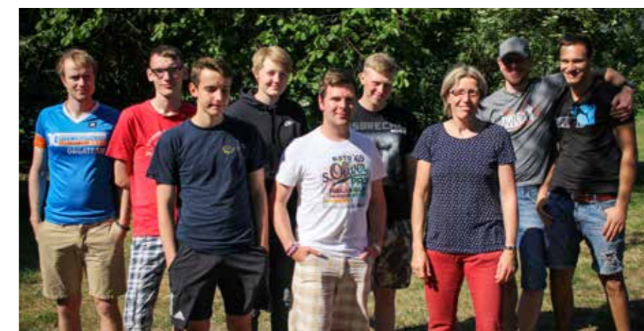
Gut gelaunte Ausbilder der ABZ Ostbad genossen das sonnige Wetter am und im Dümmer See. .

Als erstmal das Essen auf dem Tisch stand, konnten alle Ausbilder entspannt in das Wochenende starten. Zuvor ging es für die kleine, aber gut gelaunte Gruppe aus dem Ostbads mit DLRG-Bullis von Münster zum Dümmer See. Im CVJM-Freizeitheim Burlage mussten dann zuerst Betten bezogen werden und Essen gekocht werden, bevor es zum gemütlichen Teil überging. Den Abend haben die Ausbilder bei dem sehr guten Wetter dann draußen ausklingen lassen, mit Kubb und Gesellschaftsspielen