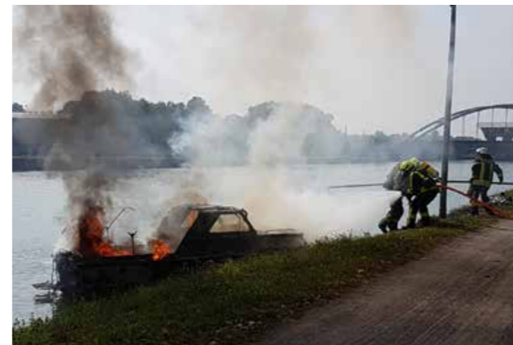
Feuerwehrleute löschen die brennende Yacht auf dem Dortmund-Ems-Kanal. Personen wurden nicht verletzt, das Sportboot brannte jedoch komplett aus.