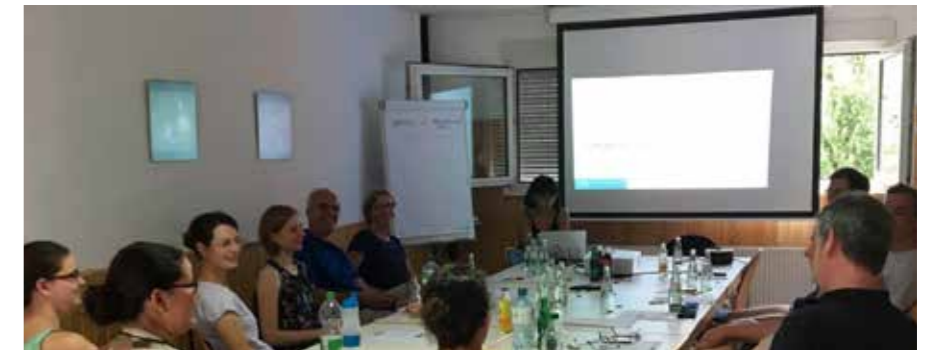
Anregende Diskussionen und auch die eine oder andere durchaus lustige Übung sorgten für ein abwechslungsreiches Fortbildungsprogramm, das bei den Teilnehmern durchweg gut ankam.

Und dass auch einige unserer Begriffe bei genauem Hinschauen erstaunlich verwirrend sein können wurde am Beispiel des „Schnupperkurses“ deutlich – etwa ein Riechseminar?