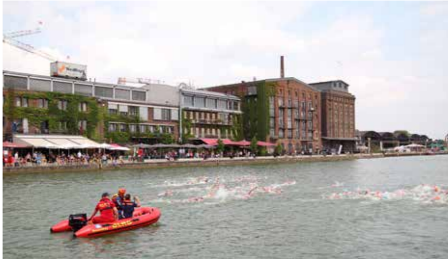
Während die Bundesliga-Triathleten sich durch das Wasser kämpfen begleiten die Kameraden das Rennen entspannt vom Boot aus.

Neben der drei Rettungsboote der DLRG Münster unterstützten uns auch zahlreiche Einsatzkräfte der DLRG Ortsgruppe Oelde und der Logistiktrupp der DLRG Sasenberg, welcher für die Verpflegung der Einsatzkräfte zuständig war. Die Rettungsboote sowie Strömungsrettertrupps wurden im Hafenbecken, wie auch entlang der Laufstrecke auf dem Kanal verteilt. So war die Sicherheit aller Teilnehmer des Sparda-Münster City Triathlons gewährleistet und es konnte im Notfall direkt eingegriffen werden.