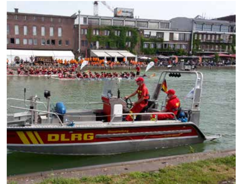
Einsatzkräfte der DLRG begleiten ein Rennen des Drachenbootcups im Münsteraner Stadthafen.