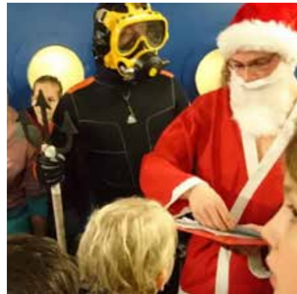
Abzeichen und Stutenkerle für alle.