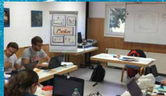
Mentoren Lehrscheinausbildung: Seite 14.