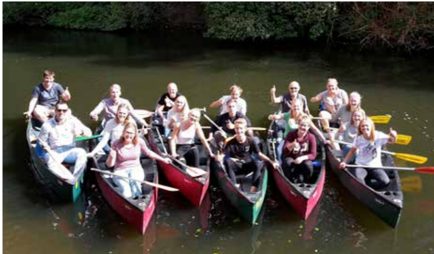
Das trotz des Wetters gut gelaunte Ausbildungsteam des ABZ Hiltrups paddelte in Kanus die Werse entlang.