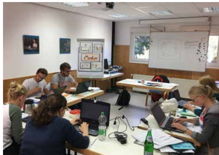
Für die Teilnehmer stand viel Gruppen- und Projektarbeit auf dem Lehrgangsprogramm.

Daniel Hüsken statt. Wie im Vorjahr wurde hier mit den Themen Weg zum Lehrschein, Aufbau ei-