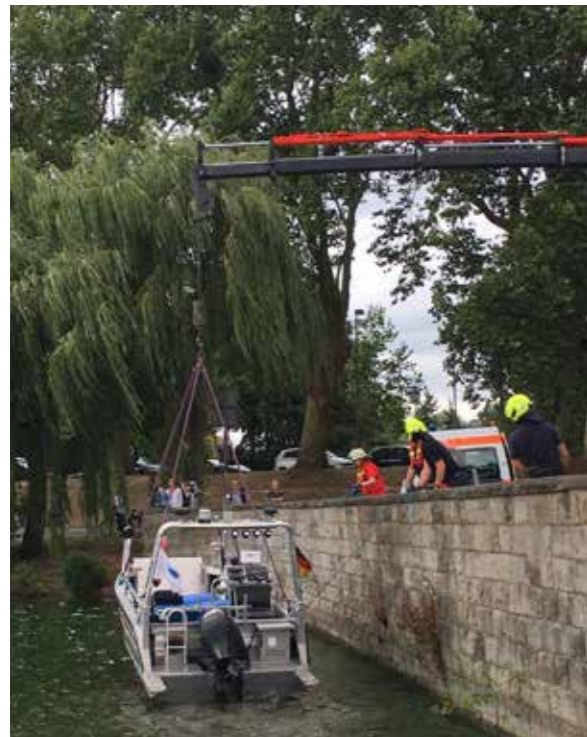
Das DLRG Boot wird für den Einsatz auf dem Aasee vorbereitet.