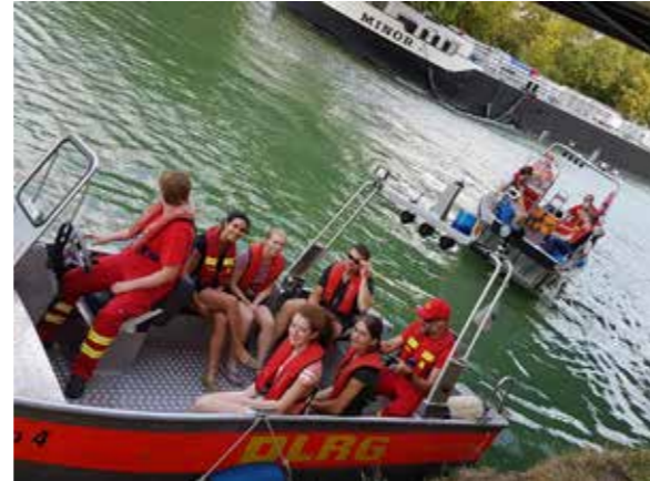
DLRG und DRK waren gemeinsam auf dem Wasser unterwegs.

sehr genossen und freuen uns auf die gemeinsame Zusammenarbeit auch in Zukunft! Ihr seid immer wieder willkommen!