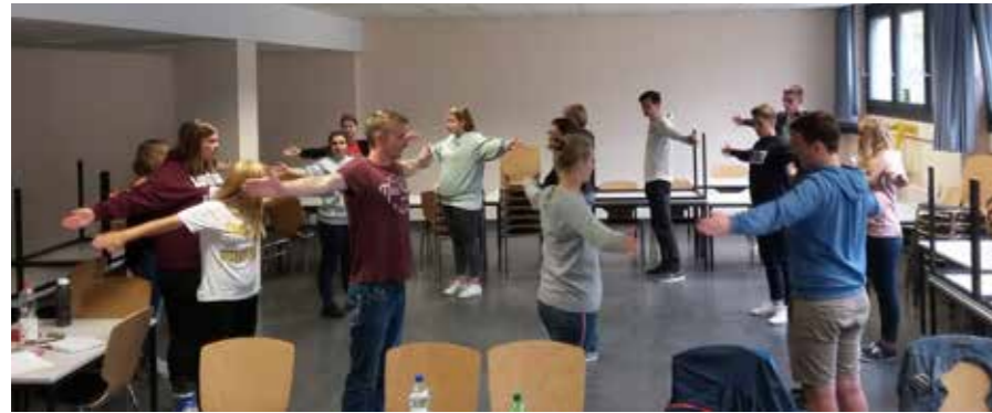
Dehnübungen, Gruppenspiele und viel weiteres abwechslungsreiches Programm standen auf dem Lehrplan.

Verschiedene Bäder, verschiedene Altersgruppen, ein Ziel: 18 Teilnehmer haben sich am 08. und 09. September versammelt, um an dem Lehrgang „Ausbildungsassistent Schwimmen“ (ASS) teilzunehmen.