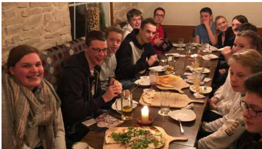
Für jeden war der passende Flammkuchen dabei.